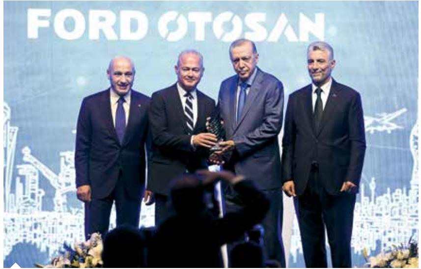
Cumhurbaşkanı Erdoğan, son 7 yıldır Türkiye ihracat şampiyonu olma başarısı gösteren Ford Otosan'ın ödülünü Genel Müdür Güven Özyurt'a verdi.