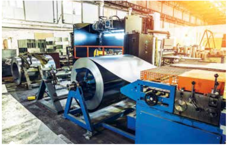
AKİB, 2022 yılında yüzde 2 artışla ve 4,6 milyar dolarlık ihracat gerçekleştirdi.

Topluluğu pazarlarında varlık gösteren AKİB, uzak pazarların da kilidini açtı. AKİB'in 2022 yılındaki ihracatı ülkelere göre değerlendirildiğinde, en yüksek değerlere ulaşılan ülkeler Irak, Hollanda ve Güney Afrika Cumhuriyeti oldu. Ülkeler düzeyinde ihracat hacminde en güçlü artışlar ise Güney Afrika Cumhuriyeti, Kuzey Kıbrıs Türk Cumhuriyeti (KKTC) ve Fas pazarlarında gerçekleşti.