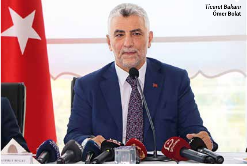
Ticaret Bakanı Ömer Bolat